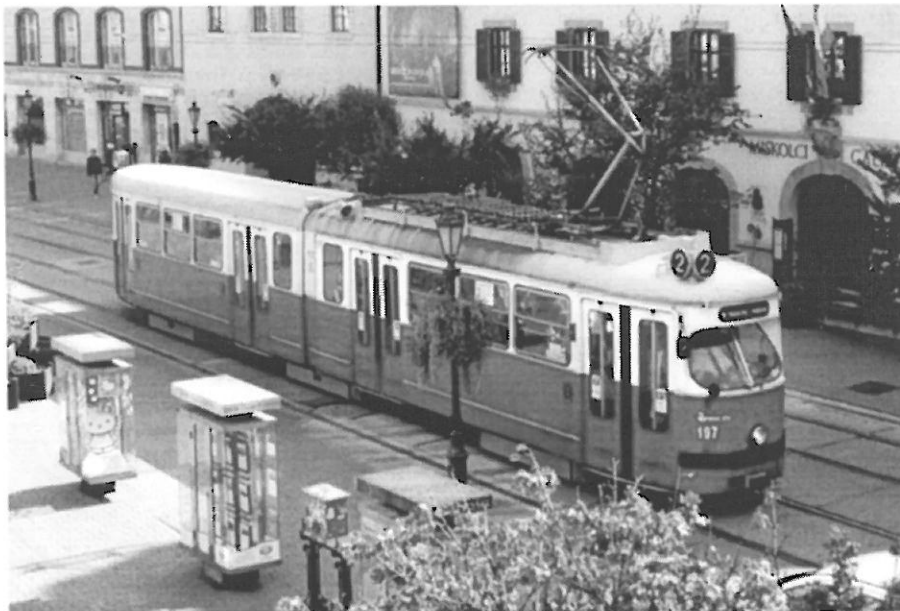
Bécsi, alias Ampervadász Piroska

A Konferencia első napjának méltó lezárásaként nosztalgia villamosozásra kerül sor a Miskolc Városi Közlekedési Zrt. jóvoltából. Az 1969-es gyártmányú, idén 50 éves, SGP E1 típusú „Bécsi, alias Ampervadász Piroska” nevet viselő nosztalgia villamossal, „akit” 2018-ban a Miskolci Egyetem Villamosmérnöki Tanácsa Tiszteletbeli Tagjának választott. Bécsi, alias Ampervadász Piroskát a Tiszai Pályaudvaron indulás előtt méltóképpen köszöntjük az 50 éves évforduló alkalmából. Az Egyetemváros és a Tiszai Pályaudvar között a nosztalgia villamosozás kezdete előtt és vége után közvetlen busztranszfert biztosítanak számunkra. A programon való részvétel az első 50 jelentkezőnek ingyenes.